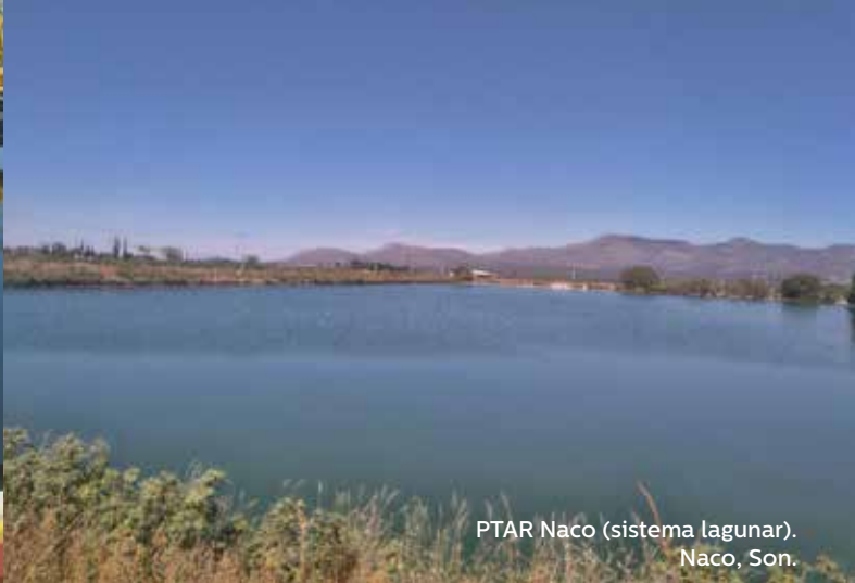
PTAR Naco (sistema lagunar). Naco, Son.