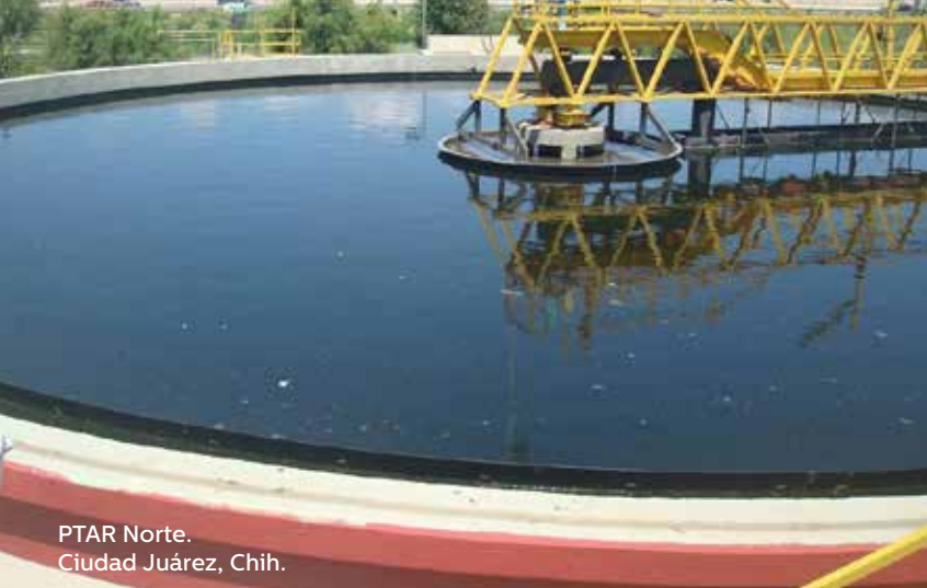
PTAR Norte. Ciudad Juárez, Chih.