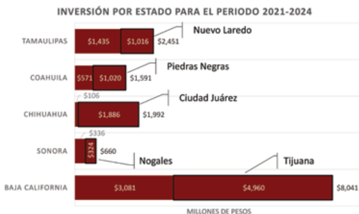
Figura 2. Inversión por estado para el periodo 2021-2024.

Para el periodo 2021-2024 se requieren 14,735 mdp (aproximadamente 720 mdd), principalmente para las ciudades de Tijuana, B.C.; Nogales, Son.; Ciudad Juárez, Chih.; Piedras Negras, Coah.; y Nuevo Laredo, Tamps.