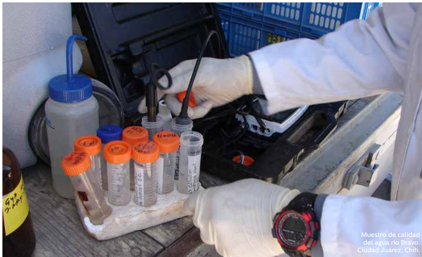
Muestra de calidad del agua río Bravo. Ciudad Juárez, Chih.

Es necesario encontrar formas de atraer más recursos públicos de México, de Estados Unidos y de organismos binacionales para los sistemas de agua y saneamiento de las principales ciudades de la frontera norte, así como una mayor cooperación entre los tres órdenes de gobierno para la implementación de acciones.